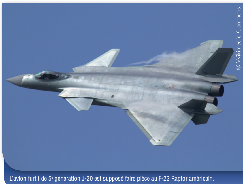
L'avion furtif de 5 e génération J-20 est supposé faire pièce au F-22 Raptor américain.

Historiquement, la Chine n'a jamais eu de goût pour des expansions impérialistes, du moins hors de son imperium. En revanche, confrontée aux invasions des tribus mongoles et mandchoues venant des steppes, elle a dû construire la Grande muraille, « ligne Maginot » dont l'élaboration s'est étendue sur 1700 ans. Mais la Grande muraille n'a été d'aucune utilité lorsqu'à partir du XIX e siècle, les Britanniques pénétrèrent l'Empire à partir de ses ports, pour lui imposer une première mondialisation et le commerce de l'Opium.