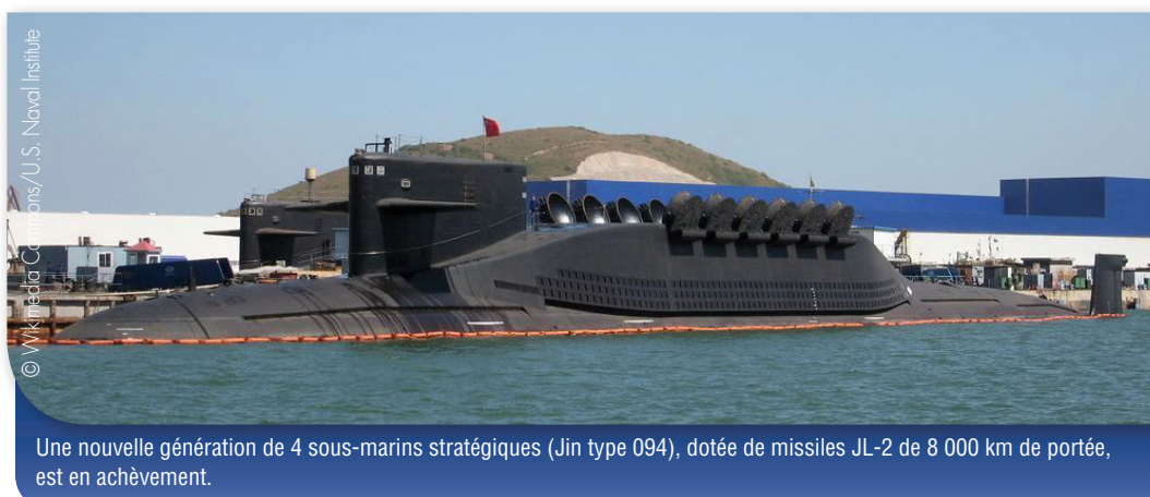
Une nouvelle génération de 4 sous-marins stratégiques (Jin type 094), dotée de missiles JL-2 de 8 000 km de portée, est en achèvement.