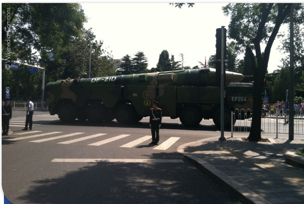
Le missile balistique antinavire Dongfeng-21D, vu à Pékin en septembre 2015.

Elle a bénéficié pleinement de coopération avec des industriels russes (Sukhoi 27, Sukhoi 30) par des acquisitions, des licences de production contractuelles et aussi des opérations de reverse-engineering (J-11B). Une aide probable d'experts israéliens semble être à l'origine du chasseur J-10A, potentiellement inspiré par le Lavi, un prototype israélien. Le J-10A est désormais en service en relativement grand nombre, en remplacement d'appareils dérivés des Mig 21. L'industrie chinoise a aussi dévoilé le chasseur de 5 e génération J-20, pour faire pièce au F-22 Raptor.